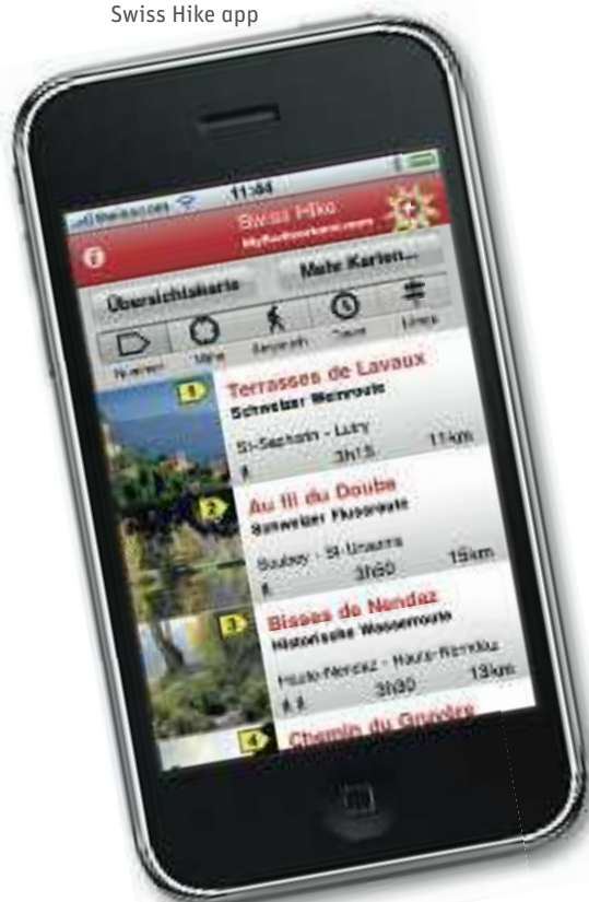
Swiss Hike app

Pointercards is een handige vertaalhulp, zeker voor wie naar landen gaat waar de taal een echte barrière kan zijn, zoals China en Japan. Maar ook in Spanje of Portugal kan het handig zijn om simpelweg een afbeelding aan te wijzen op je iPhone zo-