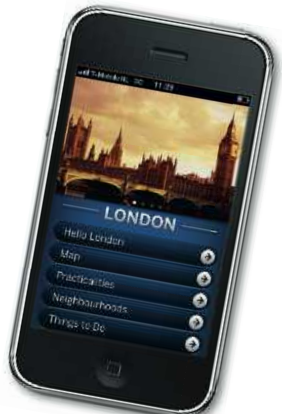
Loney Planet London app

Het Zwitsers Verkeersbureau gebruikt officiële topografische kaarten voor de wandelroutes op je iPhone. Met MotionX is het eenvoudig om via gps routes uit te zetten