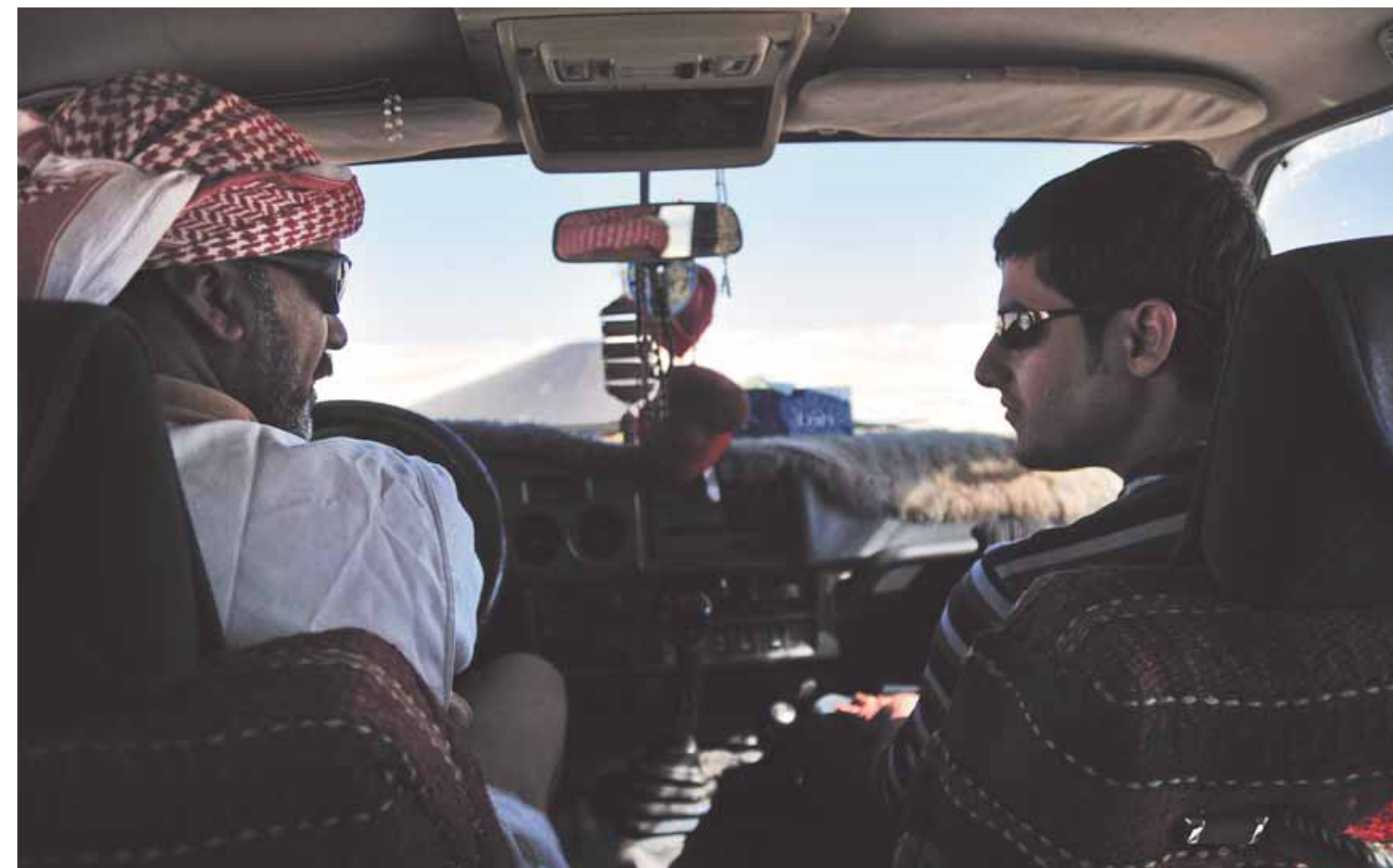
Boven: De chauffeur in overleg met onze gids