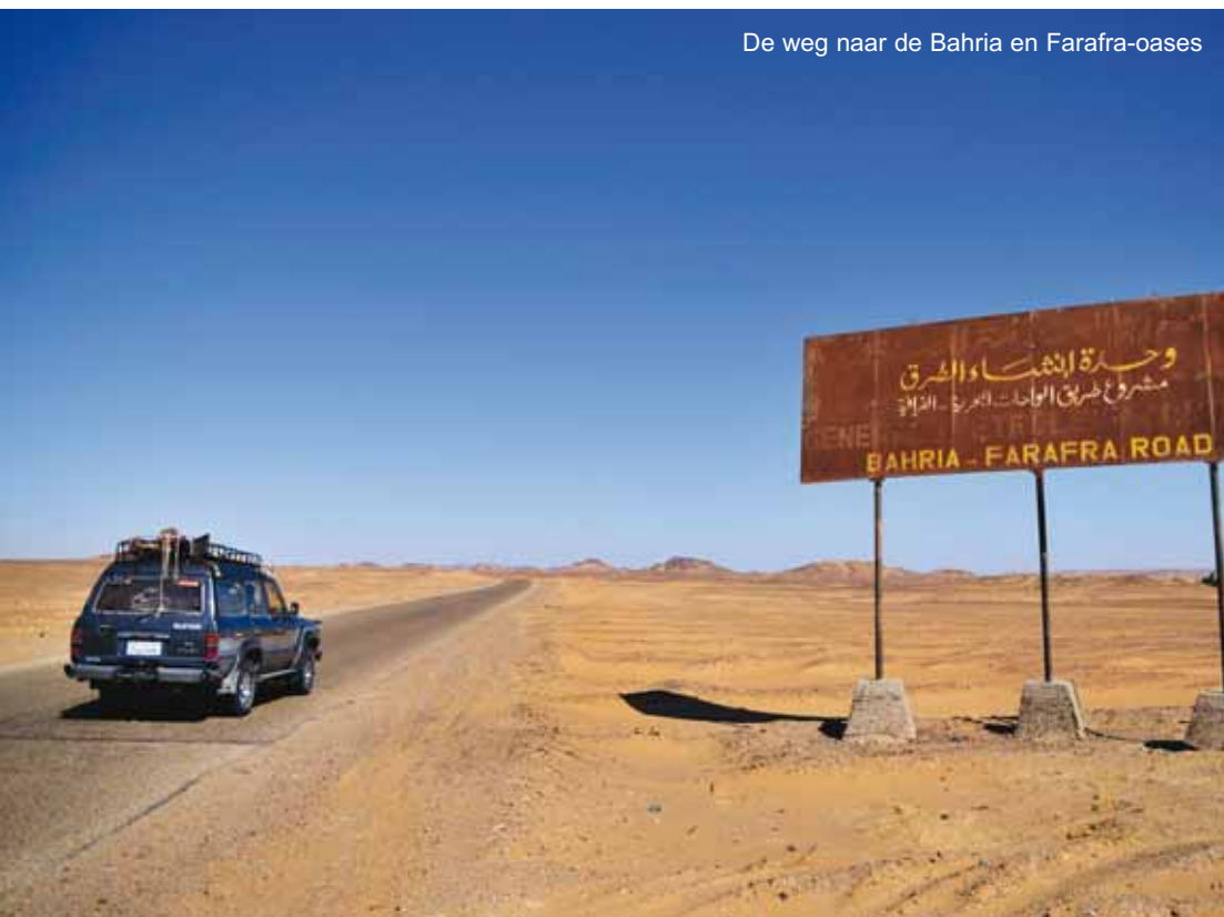
De weg naar de Bahria en Farafra-oases

Dit gebied kent talloze fascinerende verhalen. De meest opvallende is wel die van het verdwenen Perzische leger. In 525 v. Chr. verdween een leger van 50.000 man van de Perzische keizer Cambyses II in het niets nadat ze de woestijn in waren gelopen. Tot op de dag vandaag is er niets over hun lot bekend. Wetenschappers hebben al op talloze plekken gezocht en hebben zelfs in 2004 de hulp van toeristen ingeschakeld om sporen van dit immense leger te vinden. Maar ook ik ontdek ze niet. Wel zie ik andere dingen. Zo ligt de bodem van de Witte Woestijn bezaaid met fossielen. Van allerlei planten en dieren uit lang vervlogen tijden. Toen deze woestijn nog een immens binnenzee was. Waar zelfs walvissen rondzwommen. De botten liggen hier nog. Het toont aan dat een woestijn veel meer kan zijn dan een dode zandvlakte. Als je maar iets verder kijkt dan de eerste zandkorrel.