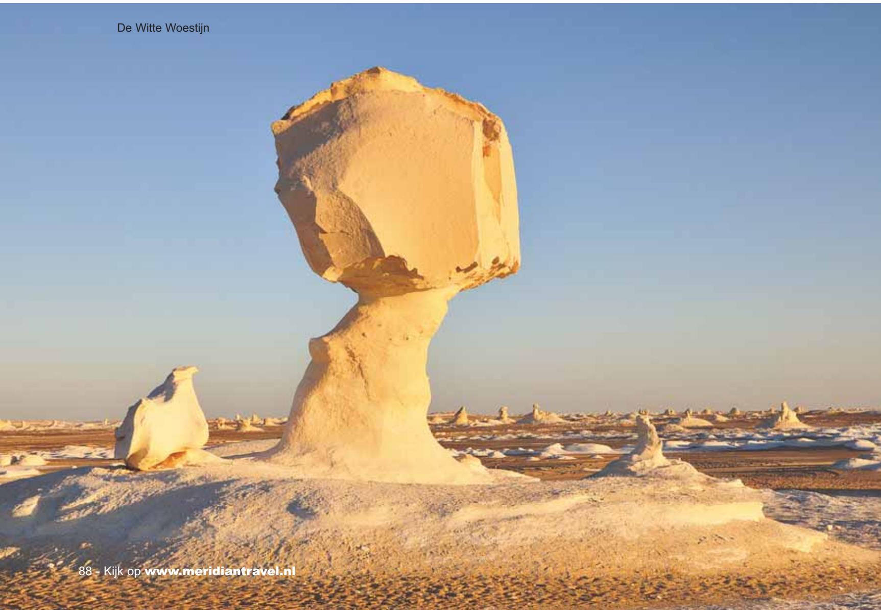
De Witte Woestijn