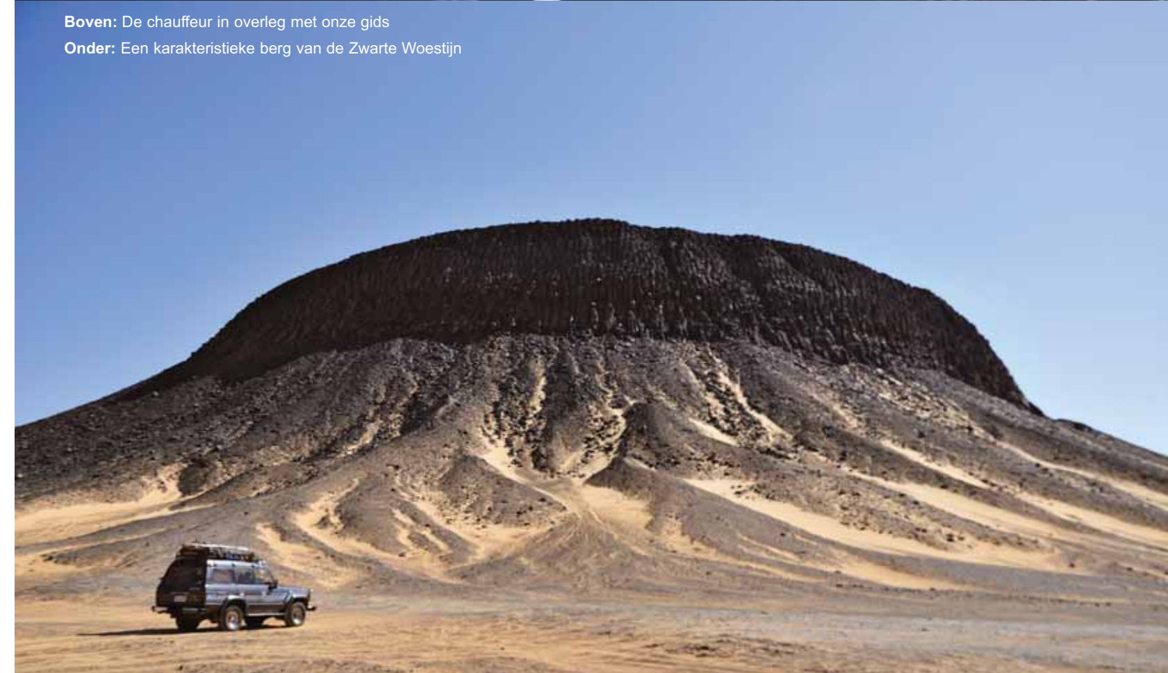
Onder: Een karakteristieke berg van de Zwarte Woestijn