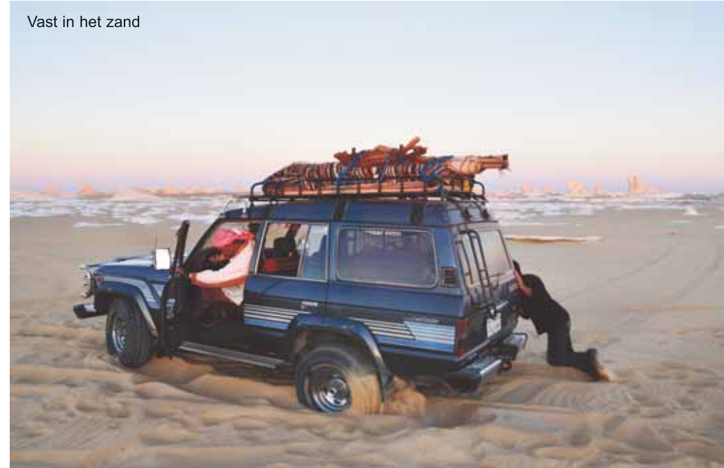
Vast in het zand

Ik kijk verbaasd naar de Gouden Mummies in de Bahariya-oase. Deze werden pas in 1999 ontdekt. Hier zijn meer dan 100 mummies gevonden in het graf van Djed-chonsoe-ioef-anch, een heerser uit de 26e dynastie (747 tot 332 v. Chr). Wel bijzonder is dat de