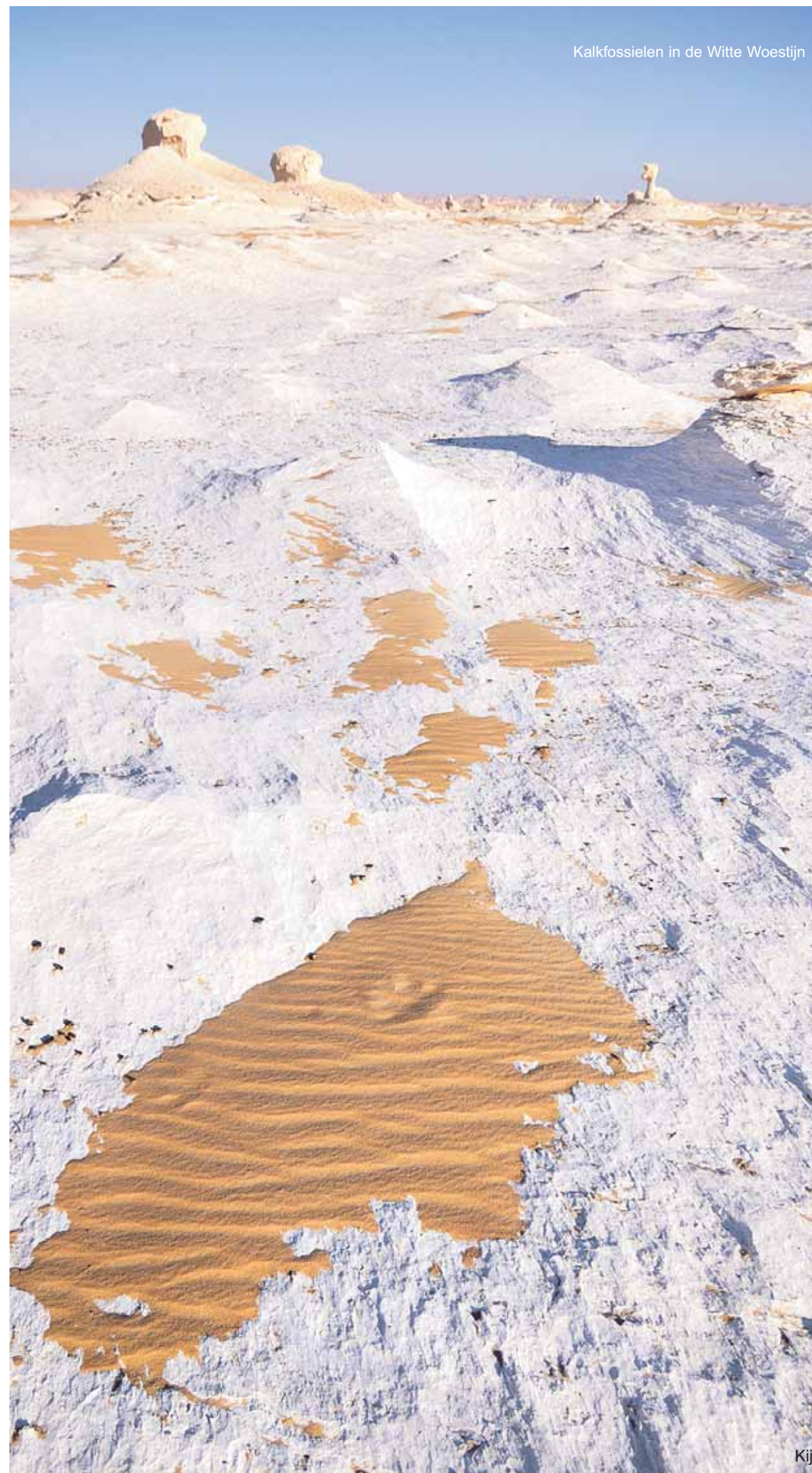
Kalkfossielen in de Witte Woestijn

Lees meer over de Westelijke Woestijn en andere bijzondere bestemmingen op www.droomplekken.nl