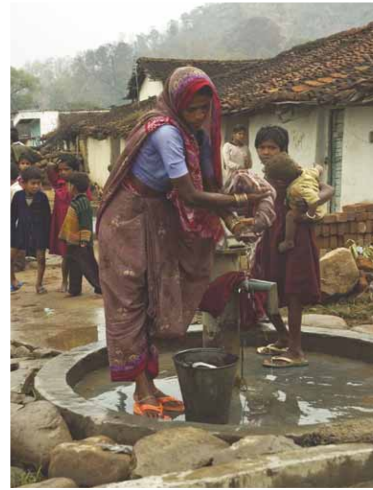
Boven vanaf linksboven met de klok mee Pootafdrukken in het zand; Tijger ligt midden op de weg; Zo dichtbij kwam deze tijger Rechtterpagina vanaf linksboven met de klok mee Een lokale vrouw; Het dorpje Tana grenst aan Bandhavgar; Lokale bevolking met vee vreest de tijger; Oude tempels worden langzaam overgroeid

tolpoortje. Elke jeep krijgt tevens een verplichte route toegewezen. Anders rijdt iedereen direct naar het moerasgebied waar veel dieren komen en het zicht goed is. Iedereen heeft haast, want 's ochtends heb je de beste kans om tijgers te zien.