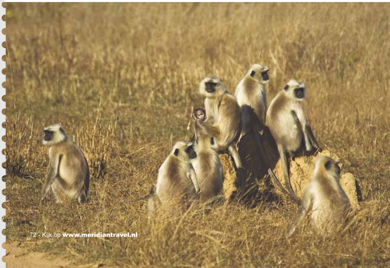
Een groep langoeren