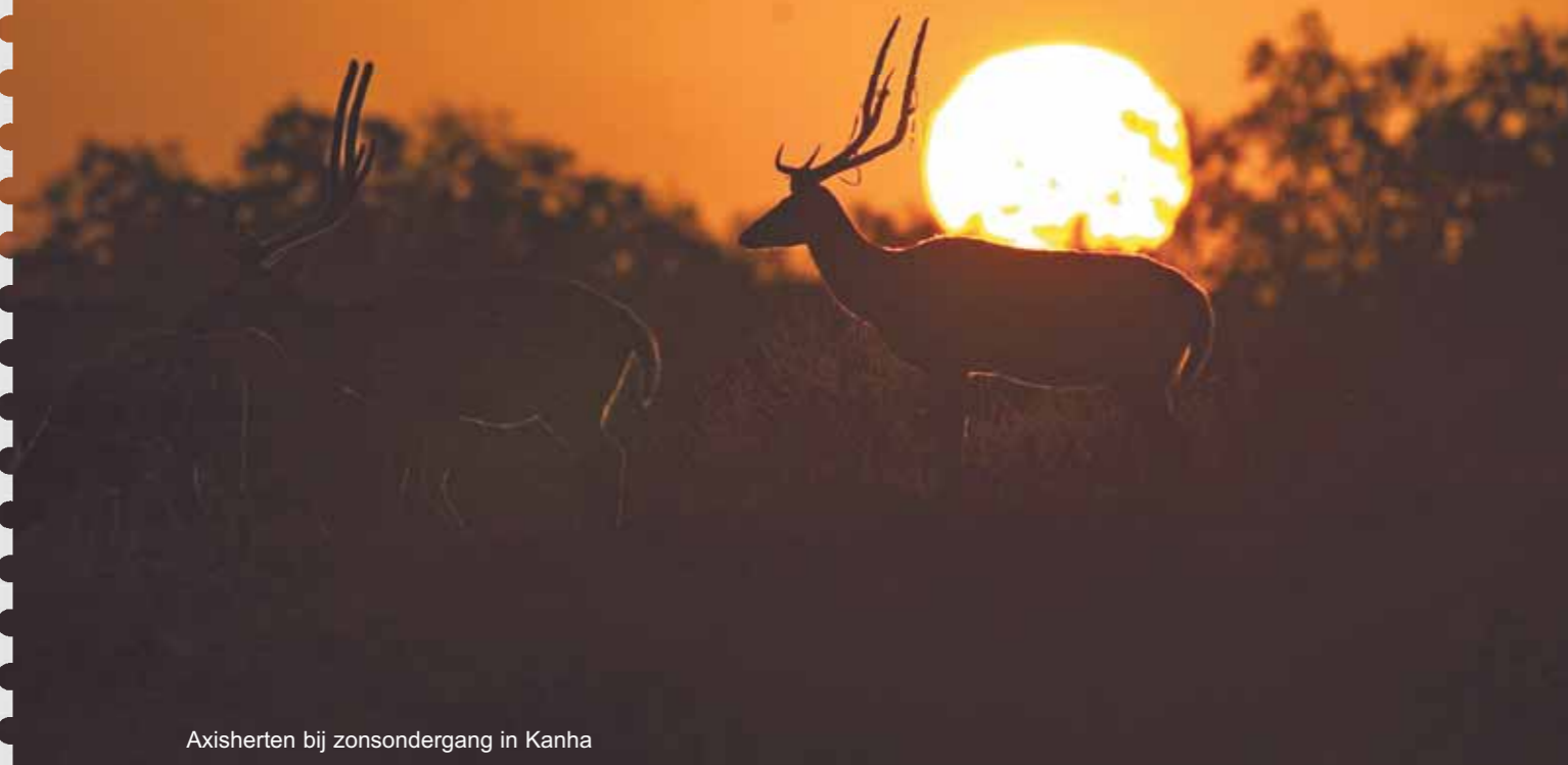
Axisherten bij zonsondergang in Kanha